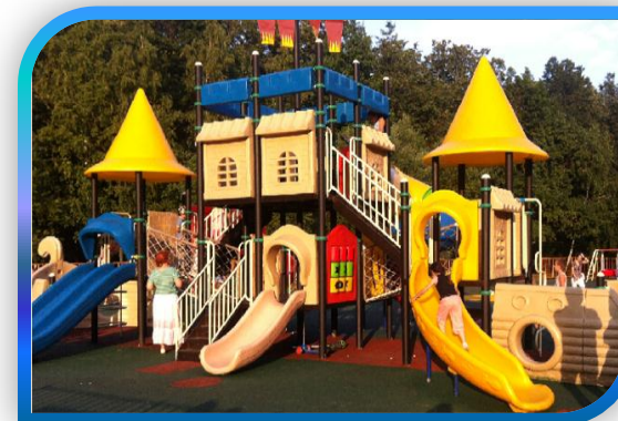
НОВЫЕ ЧЕРЁМУШКИ, КВАРТАЛ 32А, КОРП. 4