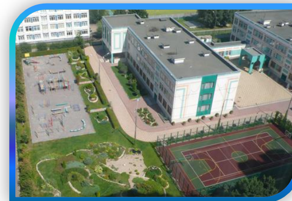
ГБОУ ЦО № 2006, УЛ. ГРИНА, 18-3, СТР. 1