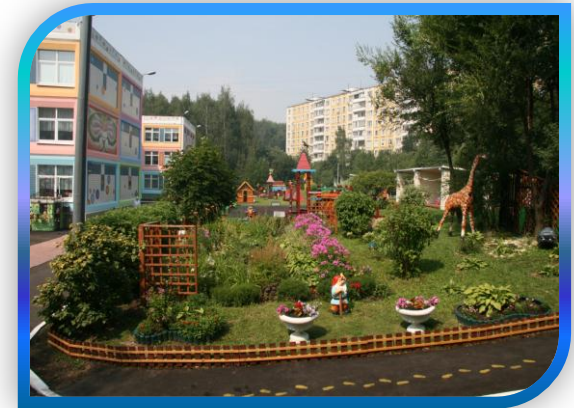
ДОУ № 1775, УЛ. ТАРУССКАЯ, 6-2