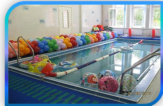
ДОУ № 1657, УЛ. ГЕНЕРАЛА ТЮЛЕНЕВА, 4А

Увеличение числа мест в дошкольных учреждениях в 2012 году позволило принять всех детей-москвичей старше 3-х лет в дошкольные образовательные учреждения.