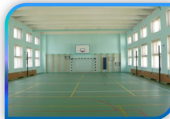
ГБОУ СОШ № 1358, УЛ. ГРИНА, 18Б

В 2012 году в первые классы школ округа поступило 11029 учащихся, что на 939 учащихся больше, чем в 2011 году.