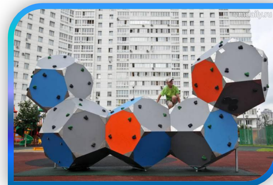
ЛЕНИНСКИЙ ПРОСПЕКТ, 131

■ ВЫПОЛНЕНО ■ ВЫПОЛНЕНИЕ > 50% ■ ВЫПОЛНЕНИЕ < 50%