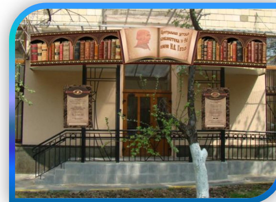
СЕМЕЙНЫЙ БИБЛИОЦЕНТР – ЦЕНТРАЛЬНАЯ ДЕТСКАЯ БИБЛИОТЕКА № 96 ИМ. Н.В. ГОГОЛЯ