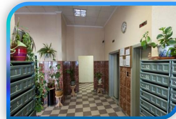
НОВЫЕ ЧЕРЁМУШКИ, КВАРТАЛ 32А, КОРП. 4