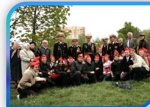
ВСТРЕЧА ПРЕДСТАВИТЕЛЕЙ ДЕТСКОГО АКТИВА С ВЕТЕРАНАМИ- ЧЛЕНАМИ КЛУБА АДМИРАЛОВ, ЯСЕНЕВО