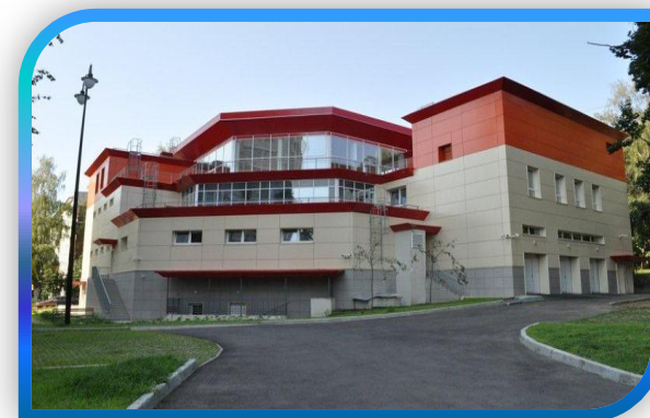
ФОК СДЮСШОР «НАГОРНАЯ», НАГОРНЫЙ БУЛЬВАР, 17А

Созданные условия для занятия спортом позволяют каждому 4-му жителю округа заниматься физической культурой и спортом.