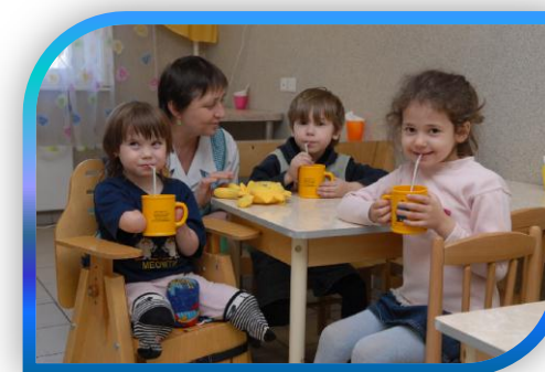
ЦЕНТР ПОМОЩИ СЕМЬЕ И ДЕТАМ «ГЕЛИОС», ЮЖНОЕ БУТОВО

Количество социально-реабилитационных услуг лицам с ограничениями жизнедеятельности увеличилось на 31,1%, услуг мобильной социальной помощи возросло в 2 раза.