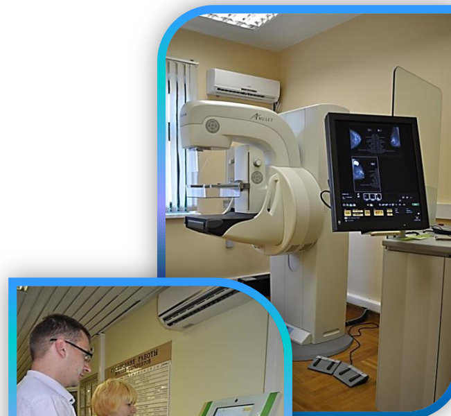
ПОЛИКЛИНИКА № 99, УЛ. ВЕНЁВСКАЯ, 27