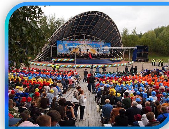
ЕЖЕГОДНОЕ ТРАДИЦИОННОЕ ОКРУЖНОЕ ПЕВЧЕСКОЕ ПОЛЕ «ПОЮЩИЙ ОКРУГ»

Развитие сети учреждений культуры позволило увеличить посещаемость учреждений культуры на 1,4%, а также их территориальную доступность.