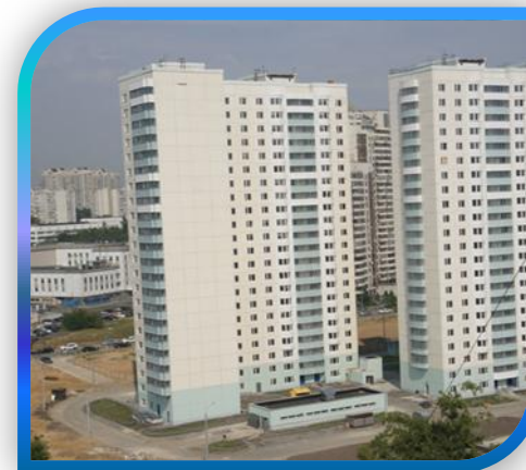
УЛ. ЮЖНОБУТОВСКАЯ, 44

Проведёнными мероприятиями улучшены условия жизни для более чем 185 000 жителей округа.