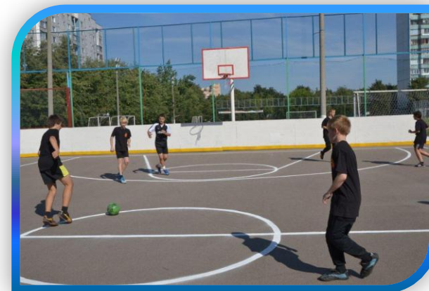
43 КВАРТАЛ ОБРУЧЕВСКОГО РАЙОНА