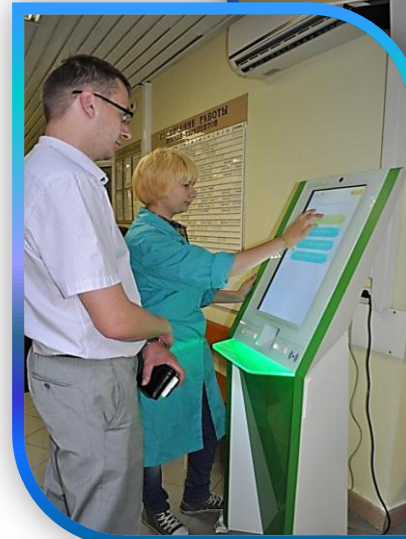
АМБУЛАТОРНЫЙ ЦЕНТР НА БАЗЕ ПОЛИКЛИНИКИ № 22, УЛ. КЕДРОВА, 24

В 2012 году в 100% амбулаторно-поликлинических учреждениях округа введена электронная запись на приём. Реализация мероприятий программы «Столичное здравоохранение» позволит расширить доступность и качество медицинских услуг.